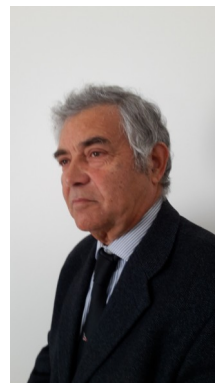
A Cura di Giuseppe Gasparri