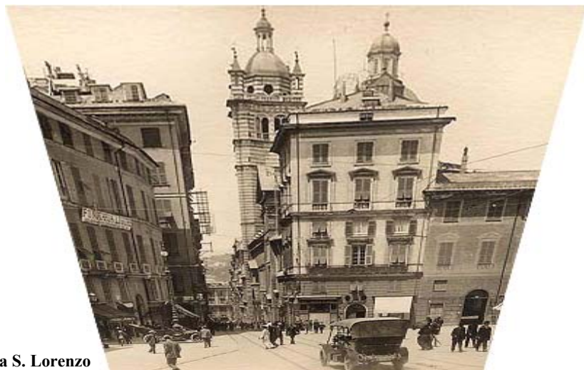
Via S. Lorenzo

Usarci-Sparci ha organizzato una visita guidata al centro storico di Genova per far conoscere ai delegati delle altre regioni, la bellezza della nostra città. L'iniziativa ha avuto un grosso successo e quasi tutti i