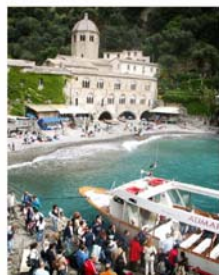
Notiziario del Sindacato Usarci - Sparci - Genova

misure di sicurezza da adottare per proteggere i dati personali